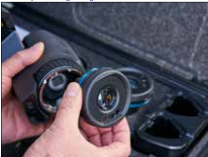
Die intelligenten AutoCal™-Wechselobjektive (Weitwinkel bis Telezoom) lassen sich auch an Ihren anderen Kameras nutzen